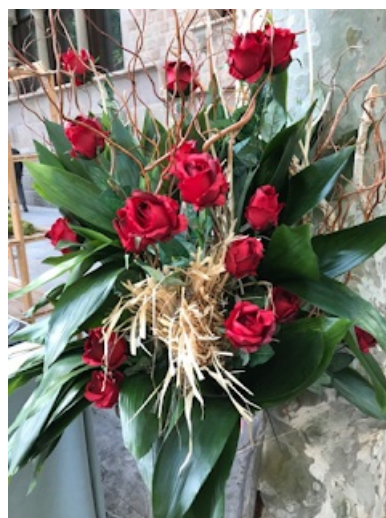
Ram de roses símbol de la diada- Barcelona 2018

La rosa, per al nostre poble, amb els anys ha esdevingut un símbol d'amor molt important i s'utilitza tot l'any per felicitar, commemorar i per enviar missatges d'amor, però és imprescindible regalar-la el dia de Sant Jordi. Tal i com va dir Brighton al 1968, un símbol és una cosa a la que un grup de persones a decidit assignar-li un significat determinat, sense que existeixi relació entre l'objecte i el que simbolitza (les flors, normalment s'empren per decorar la casa o el jardí). La rosa és un dels símbols més bonics del nostre poble, tant és així que ja comença a esdevenir un símbol d'amor estès arreu del món.